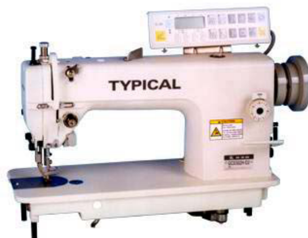
Moteur AC Servo